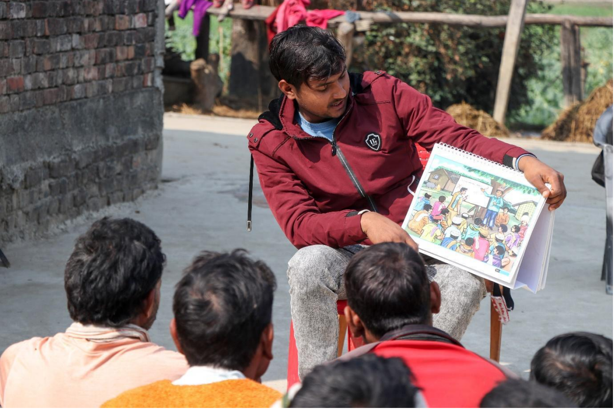
ছবিঃ কমিউনিটি ডায়লগ, হার্ড (HERD) ইন্টারন্যাশনাল, নেপাল, ২০২৪

নিম্নের বিষয়বস্তু মূল্যায়ন প্রক্রিয়ার অন্তর্ভুক্ত থাকতে পারেঃ