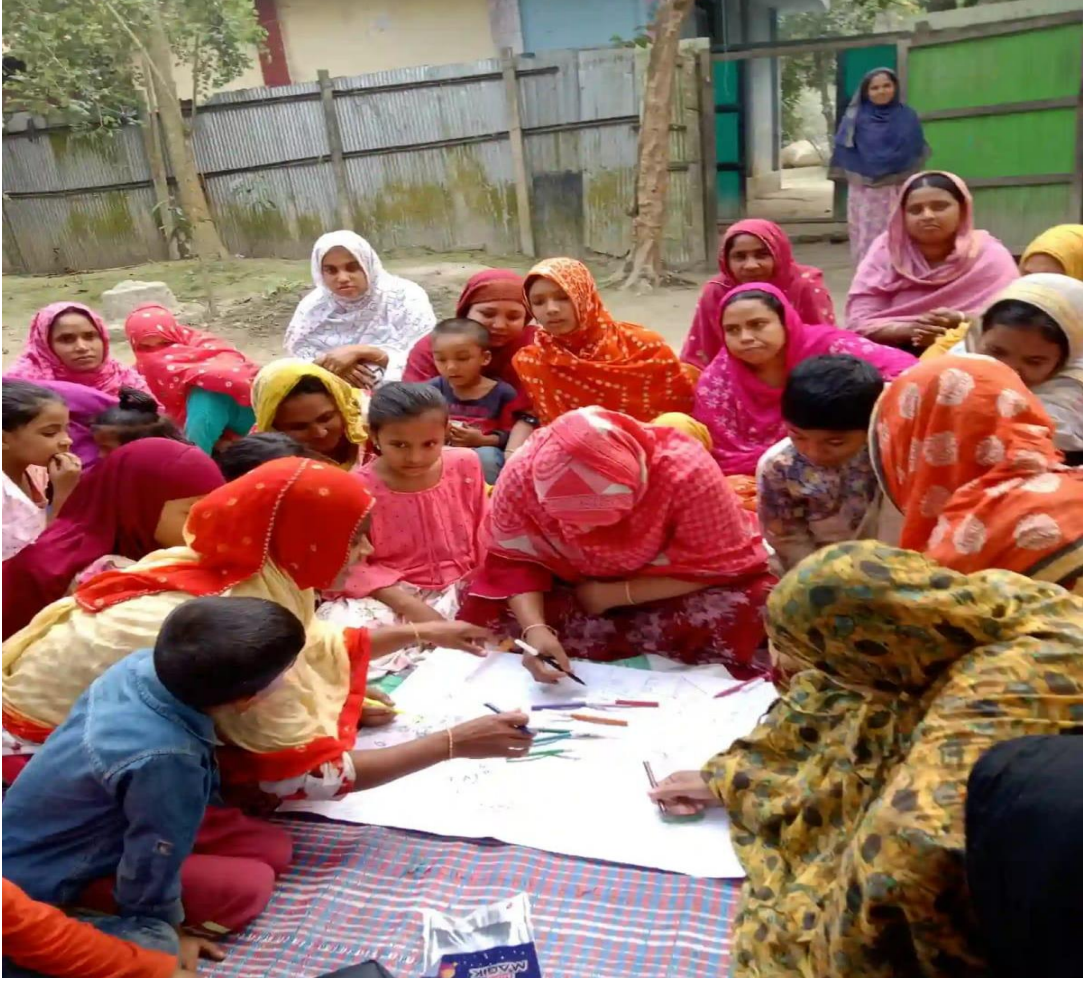
ছবিঃ কমিউনিটি ডায়ালগে নারীদের কমিউনিটি ম্যাপিং করার একটি দৃশ্য, কুমিল্লা, বাংলাদেশ

এন্টিমাইক্রোবিয়াল রেজিস্ট্যান্স বা অকার্যকারিতা প্রতিরোধে কমিউনিটি প্রদত্ত সমাধান (কমিউনিটি-লেড সলিউশনস টু অ্যান্টিমাইক্রোবিয়াল রেজিস্ট্যান্স-COSTAR) একটি ৩ বছরব্যাপী গবেষণা প্রকল্প; যা যৌথ ভাবে বাংলাদেশে র্যান্ডমাইজড কন্ট্রোলড ট্রায়াল (RCT) এবং নেপালে ফিসিবিলিটি স্টাডি এর মাধ্যমে পরিচালনা করা হচ্ছে এবং এর মূল উদ্দেশ্য হল সরকারী অবকাঠামোর মধ্যে থেকেই একটি উদ্ভাবনী ‘ওয়ান হেলথ’ আঙ্গিকে সাজানো কমিউনিটি এনগেজমেন্ট ইন্টারভেনশন কে নিবিড়ভাবে মূল্যায়ন করা। বাংলাদেশের কুমিল্লা জেলা এবং নেপালের কপিলাবস্ত্র জেলার কমিউনিটির সদস্যরা পার্টিসিপেটরি (অংশগ্রহণমূলক) ভিডিও এবং কমিউনিটি ডায়ালগ পদ্ধতি সম্পর্কে শিখছেন এবং তাদের কমিউনিটির সদস্যদেরকে অ্যান্টিমাইক্রোবিয়াল রেজিস্ট্যান্স (এএমআর) সম্পর্কে অংশগ্রহণমূলক কমিউনিটি ডায়ালগে যোগ দেয়ার জন্য একত্রিত করেছেন।