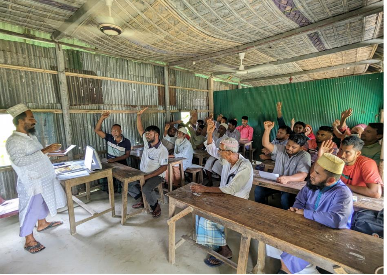
ছবিঃ বাংলাদেশে পুরুষদের নিয়ে অনুষ্ঠিত একটি কমিউনিটি ডায়লগ এর অংশবিশেষ