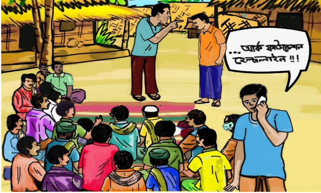
ছবিঃ বাংলাদেশে ফ্লিপবুকে ব্যবহৃত সুরক্ষা (সেফগার্ডিং) সেশনের একটি চিত্র