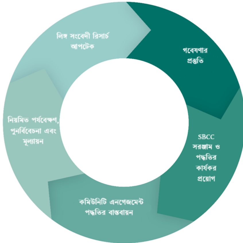
চিত্রঃ গবেষণা চক্র

যদিও অন্তর্ভুক্তির নীতি সম্পর্কিত উপরে উল্লেখিত প্রশ্নগুলি সম্পূর্ণ গবেষণা চক্রের সাথে সামঞ্জস্যপূর্ণ, তবুও এই চেকলিস্টটিকে নিম্নের প্রকল্প চক্রের মাধ্যমে (চিত্র দ্রষ্টব্য) ছয়টি বিভাগে সাজানো হয়েছে। কমিউনিটি এনগেজমেন্ট পদ্ধতিতে গবেষণার নকশা, বাস্তবায়ন এবং পর্যবেক্ষণ ও মূল্যায়নের জন্য নির্দেশিকা হিসাবে এই চেকলিস্টটিকে ব্যবহার করা যেতে পারে। টিমগুলিকে বুঝতে সাহায্য করার জন্য তারা যে সিই টুলস এবং কার্যক্রমগুলি বিকাশ করেছে তা কতটা অন্তর্ভুক্তিমূলক। বিভিন্ন প্রকল্পকে আরও বেশি জেডার রেস্পন্সিভ বা লিঙ্গ বৈষম্য সচেতন করতে এই চেকলিস্টটি ব্যবহার করা যেতে পারে।